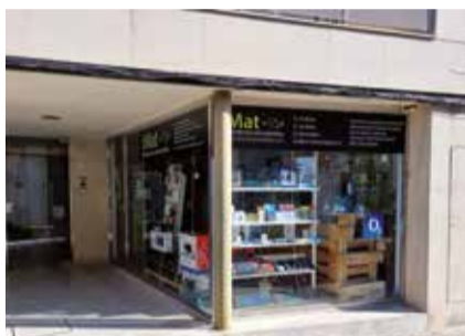
Imat s'ha traslladat al carrer Pratginestós, 10.

L'horari és de tardes, de 17 a 20 hores. El telèfon de contacte és el 636 29 00 65 i el correu electrònic, santi@informaticamatadepera.cat .