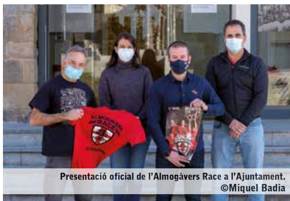
Presentació oficial de l'Almogàvers Race a l'Ajuntament.

Matadepera acollirà, el 27 de març, una nova edició de l'Almogàvers Race, una cursa d'obstacles, que, segons l'organització, ret homenatge a la valentia, la duresa, l'habilitat i l'enginy dels llegendaris guerrers medievals. La cita serà a partir de les 9:30 del matí i se sortirà i arribarà des del Club Deportivo Terrassa Hockey, patrocinador de l'esdeveniment. Hi haurà dos circuits amb 35 obstacles cadascun d'ells: Circuit Rock (12 km) i Circuit Blues (6 km). Hi podran participar corredors individualment en parella, en equip d'amics i, fins i tot, en famílies (amb infants d'entre 10 i 16 anys). Les inscripcions es poden formalitzar a: www.almogaversrace.com