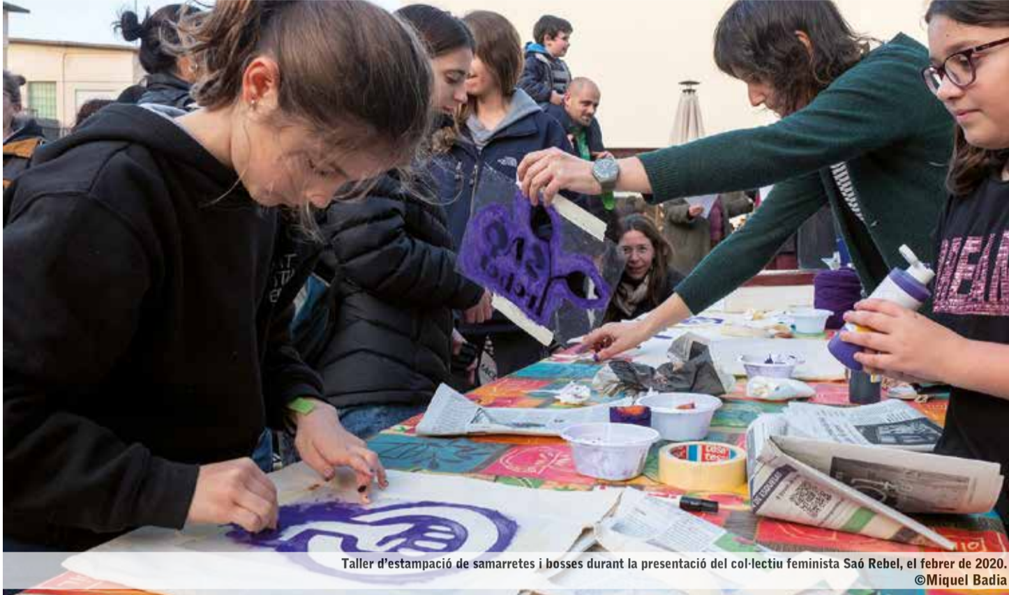
Taller d'estampació de samarretes i bosses durant la presentació del col·lectiu feminista Saó Rebel, el febrer de 2020.

TEATRE, TALLERS, XERRADES I PASSEJADES PER REIVINDICAR ELS DRETS DE LES DONES