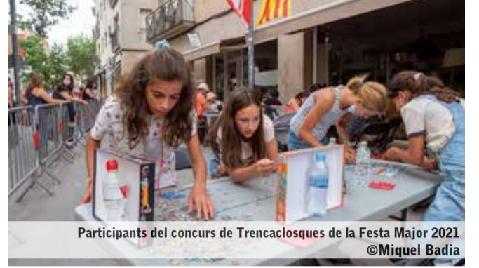
Participants del concurs de Trencaclosques de la Festa Major 2021

La Regidoria de Festes obre la convocatòria per presentar els dissenys que competiran per convertir-se en la pròxima portada del programa de la Festa Major de Matadepera. Les obres, que poden fer-se en qualsevol tècnica, es poden presentar a l'OAC fins al 21 de març. L'artista guanyador/a s'endurà 300 € i la seva creació protagonitzarà la programació festiva.