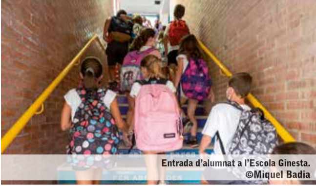
Entrada d'alumnat a l'Escola Ginesta.

El mes de març és època de portes obertes. Enguany es combinaran els formats virtuals amb la presencialitat. L'Institut Matadepera farà la presentació del centre l'1 de març amb una visita guiada en persona. Les escoles Torredemer i Ginesta també faran sessions presencials el dia 5 de març, però prèviament també hauran fet una reunió online els dies 1 i 3, respectivament.