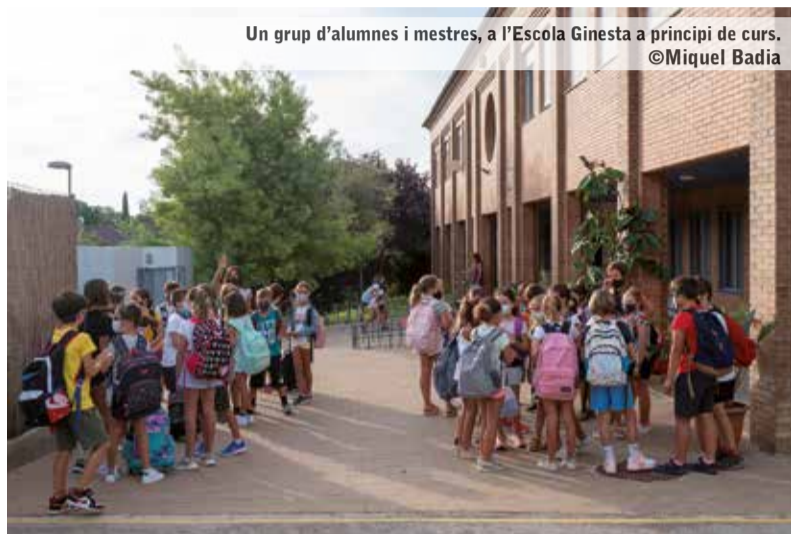
Un grup d'alumnes i mestres, a l'Escola Ginesta a principi de curs.

L'Institut Matadepera organitza una jornada de portes obertes presencial, que tindrà lloc el dimarts, 1 de març, des de les 17 h i fins a les 19:30 de la tarda. Per assistir-hi, cal omplir un formulari d'inscripció a la web de l'Institut ( https://agora.xtec.cat/iesmatadepera ). A la web de l'Institut també es penjaran vídeos per si es vol fer la visita virtual, però aquest any no s'oferirà una sessió online.