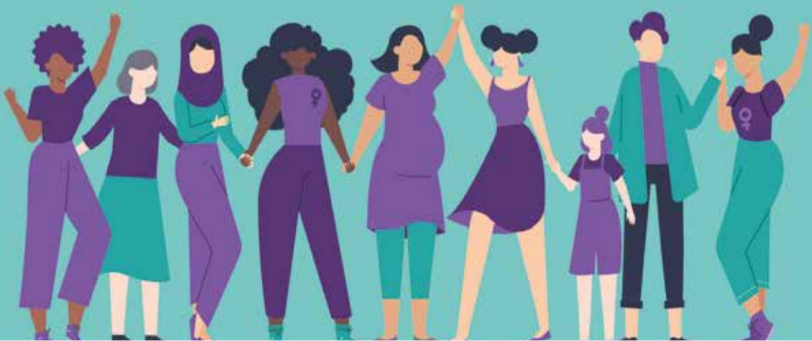
Cartell per promoure les activitats organitzades a Matadepera, pel 8 de març. ©Regidoria de Benestar Social