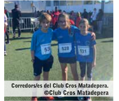
Corredors/es del Club Cros Matadepera.

El Club de Cros Matadepera va participar, el 16 de gener passat, al Campionat de Cros de Catalunya i va obtenir molt bons