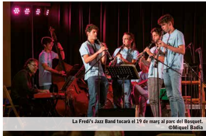
La Fredi's Jazz Band tocarà el 19 de març al parc del Bosquet.