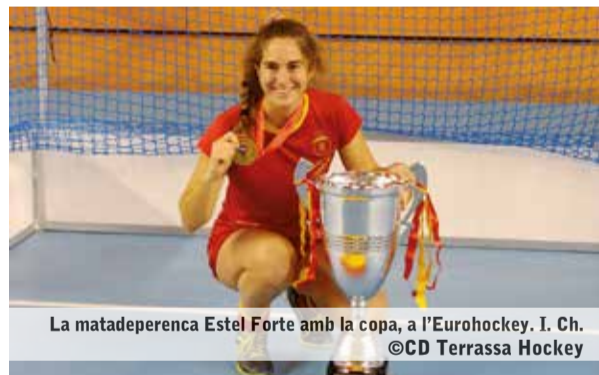
La matadepereca Estel Forte amb la copa, a l'Eurohockey.

La jugadora del CD Terrassa Hockey va participar-hi per segona vegada.