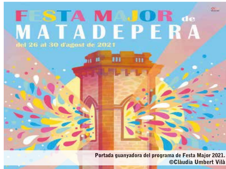
Portada guanyadora del programa de Festa Major 2021. ©Clàudia Umbert Vilà

Per qualsevol dubte, es pot contactar amb la Regidoria de Festes a través del correu: festes@matadepera.cat