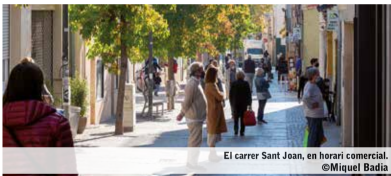
El carrer Sant Joan, en horari comercial.

La Regidoria de Promoció Econòmica, Ocupació i Comerç de l'Ajuntament de Matadepera ha fet públiques més ofertes de feina a Matadepera. En aquesta ocasió s'estan buscant cambrers amb experiència d'un any, i coneixement de la professió. Les tasques principals seran servir les taules, recollir i muntar les