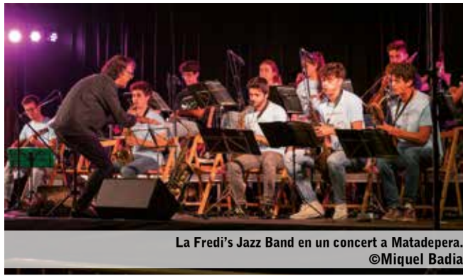
La Fredi's Jazz Band en un concert a Matadepera.