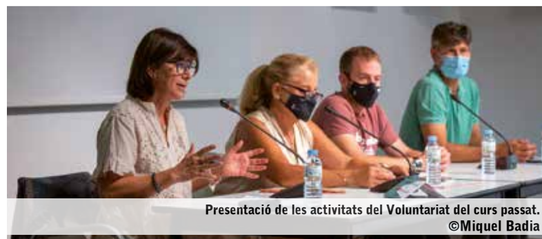
Presentació de les activitats del Voluntariat del curs passat.

mini algun ofici, tècnica o tingui alguna habilitat que pugui ensenyar, pot contactar amb el Casal de la Gent Gran, ja sigui presencialment, per correu ( casalgentgran@matadepera.cat ) o per telèfon, demanant per la responsable de les activitats del Voluntariat, Rosó Duran (656572742), o bé, deixar un missatge al contestador (937871769).