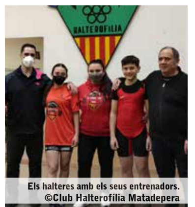
Els halteres amb els seus entrenadors.