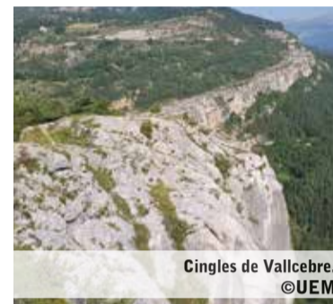
Cingles de Vallcebre.

La Unió Excursionista de Matadepera organitza, pel proper 26 de març, una nova excursió per visitar els cingles de Vallcebre. El punt de trobada serà al Pavelló Primer d'Octubre pel cantó de la riera, a les 7:30 del matí. Es tracta d'una excursió circular per un dels paratges més bonics del Berguedà. Es passarà per molts "graus", passeres de pedra que permetran pujar i baixar pels cingles i contemplar magnífiques panoràmiques del Pedraforca, Comabona, Penyes Altes.