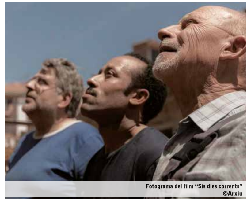
Fotograma del film "Sis dies corrents"

A Matadepera es podrà veure en versió original, el dia 25 de març. L'entrada general té un preu de 4,5 €, però hi ha descomptes per a persones amb Carnet Jove i amb els carnets de la Federació d'Ateneus de Catalunya, de família monoparental, de família nombrosa, de la Biblioteca i del Club Vanguardia. El preu també és reduït per a les persones majors de 65 anys.