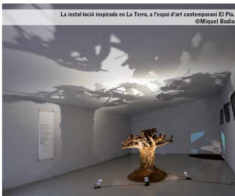
La instal·lació inspirada en La Terra, a l'espai d'art contemporani El Pla.

A partir d'aquesta reflexió, el Col·lectiu d'Art planteja una taula rodona a l'espai d'art contemporani El Pla, que tindrà lloc el dissabte 5 de març, a les 11 del matí.