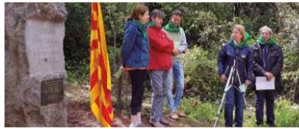
Un instant de l'acte de recordança a Joan Maragall, a Coll d'Eres.