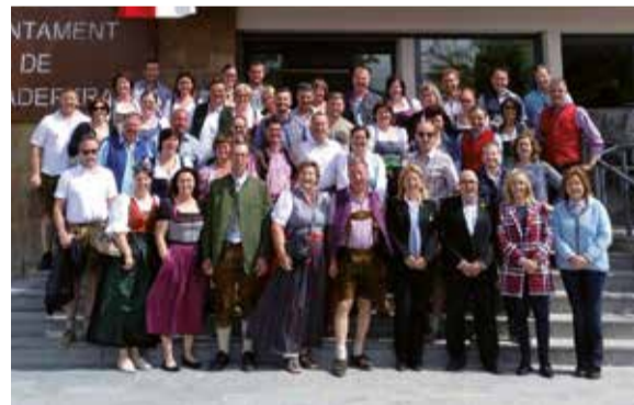
Foto de grup de la rebuda dels veïns de Mariapfarr a l'Ajuntament.

Des de l'Agermanament volem agair a tots els equipaments visitats la seva col·laboració i també la feina que fan diàriament pel nostre poble. Us deixem amb la foto de família: