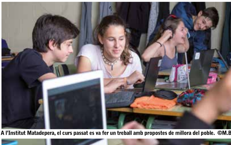
A l'Institut Matadepera, el curs passat es va fer un treball amb propostes de millora del poble.

Per tal de consolidar l'Hotel, es pretén ampliar l'oferta cultural i d'acompanyament als joves, amb els principis rectoris de la participació, la integritat i la qualitat. Així, accions concretes que es proposen són diversificar la temàtica d'activitats i els horaris (projecció de pel·lícules, jam