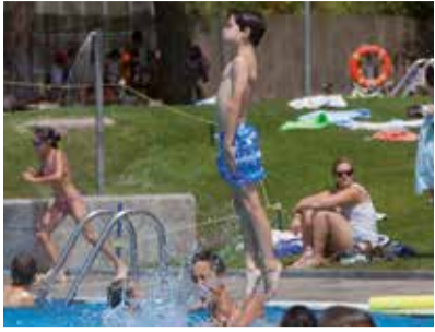
La posada en marxa de la prova pilot.