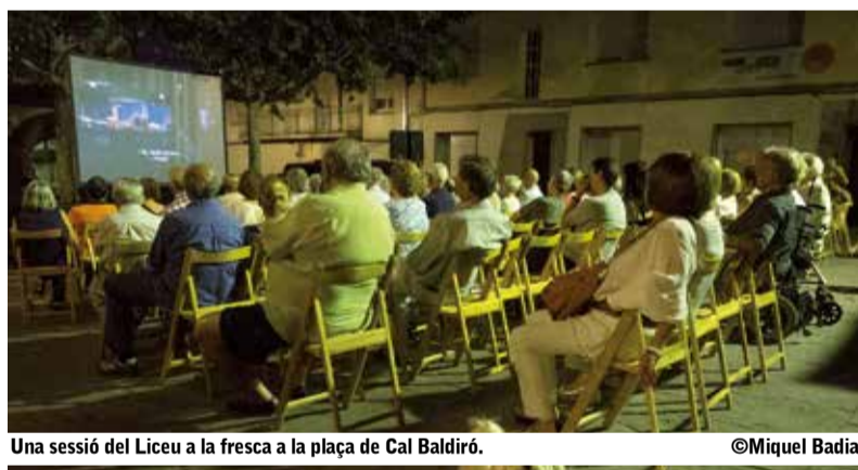
Una sessió del Liceu a la fresca a la plaça de Cal Baldiró.

La Regidoria de Cultura es torna a sumar al programa "Som Liceu" i organitza la tercera edició del "Liceu a la Fresca", que tindrà lloc el dissabte 16 de juny, a les 22 hores i a la plaça del Casal de Cultura. En aquesta ocasió, es projectarà l'òpera "Manon Lescaut", de G. Puccini. El "Liceu a la Fresca" és una iniciativa cultural, impulsada per la Fundació del Gran Teatre del Liceu per expandir i difondre la