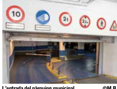
L'entrada del pàrquing municipal.

El nou Pla Local de Joventut, que estarà vigent fins al 2021 prioritzarà la consolidació de l'Hotel, dinamització juvenil i la perspectiva de gènere.