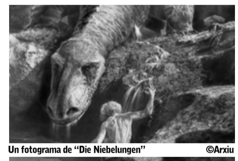
Un fotograma de "Die Nibelungen"

El CineClub Matadepera continua la seva programació oferint un cop al mes una doble sessió curosament seleccionada. Aquest mes de juny tindrà lloc el diumenge 17 a les 17 hores i a l'Hotel i s'oferirà una doble sessió (exclusiva pels més valents, tal i com apunten fonts de la mateixa organització). Serà amb les dues parts de l'èpica obra de Fritz Lang: "Die Nibelungen: Siegfrieds Tod", i "Die Nibelungen: Kriemhilds Rache", estrenades al 1924. La sessió és oberta a tothom.