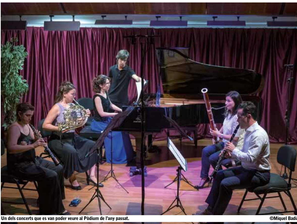
Un dels concerts que es van poder veure al Pòdium de l'any passat.