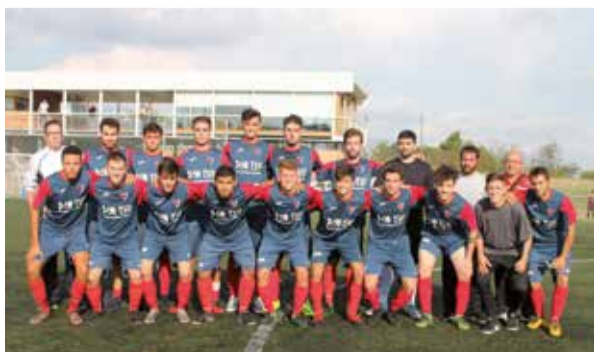
L'equip sènior B del CF Matadepera.

i 10 de juny, durant el qual més de 600 esportistes visitaran les instal·lacions del Camp de Futbol Municipal de Matadepera. Per altra banda, el 16 i 17 de juny, el club matadeperenc tornarà a participar en el Torneig Vila de Lloret. A la passada edició del torneig, el Matadepera va ser el club amb més representació, ja que hi van assistir uns 150 jugadors/es. Finalment, al llarg del mes de juliol, el CF Matadepera organitza el seu tradicional Campus d'Estiu.