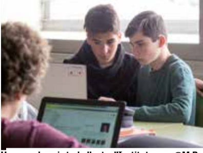
Un grup de nois treballant a l'Institut.

Matadepera Comerç, l'empresa concessionària i l'Ajuntament han arribat a un acord per oferir la primera hora d'estacionament gratuït al pàrquing del Casal de Cultura.