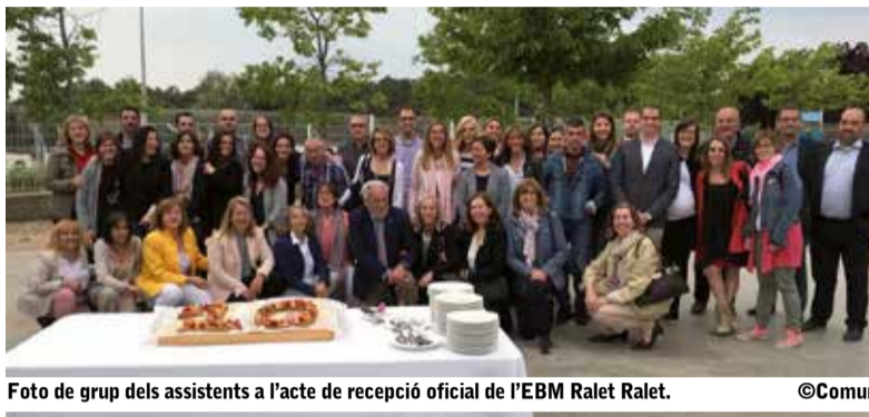
Foto de grup dels assistents a l'acte de recepció oficial de l'EBM Ralet Ralet.

Un any després, el 2006, van començar les obres de construcció de l'edifici i, l'estiu de 2007, l'EBM Ralet Ralet ja era una realitat que calia moblar, adequar i tenir a punt l'1 de setembre, per començar el curs escolar. L'equip