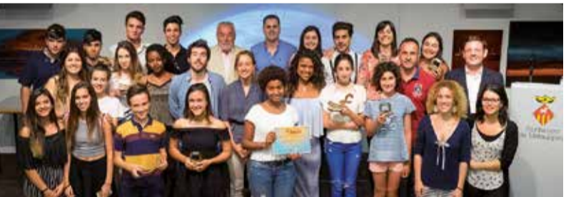
Foto de grup amb els guanyadors/es de la passada edició dels premis FILMAT.

obert fins a l'11 d'octubre vinent. Com en les darreres edicions, hi haurà diversos premis per: la millor obra de la categoria d'adults, la millor obra realitzada per menors de 18 anys, la millor creació dels alumnes d'un centre educatiu i la millor obra local (guardonada amb un xec regal de Matadepera Comerç). Enguany, el Filmat torna a comptar amb la col·laboració del Parc Audiovisual de Catalunya i Matadepera Comerç.