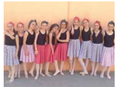
Les ballarines del centre Entreactes.

El 21 d'abril passat, el centre de creació i moviment Entreactes, va actuar a Moià, amb motiu del Dia Internacional de la Dansa. Per altra banda, el proper 3 de juny, Entreactes oferirà la mostra de final de curs, al Centre Cultural de Terrassa.