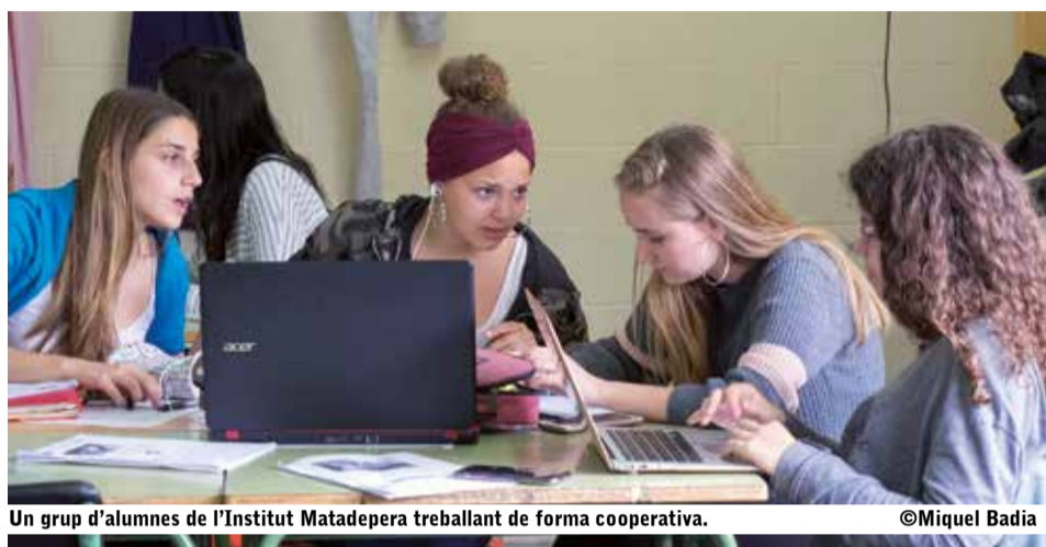
Un grup d'alumnes de l'Institut Matadepera treballant de forma cooperativa.

El projecte Escola Nova 21 proposa una transformació del sistema educatiu, que es centri en el desenvolupament de competències i en un aprenentatge basat en l'alumne com a protagonista.