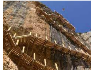
Un tram del Congost de Mont-rebei

La sortida de Matadepera es farà a les 7 del matí del 9 o 10 de juny (dia encara per definir). La caminada s'iniciarà des de l'aparcament gratuït de Montfalcó fins al punt d'informació La Masieta, uns 8 km en total amb 463 m de desnivell positiu. El trajecte dura unes tres hores, sense comptar aturades, i no és apte per a persones amb vertigen. La sortida és gratuïta pels socis i té un cost de 5 € pels qui encara no ho són. Per a inscripcions i més informació: uem@uem.cat, www.uem.cat o al telèfon 608 096 668.