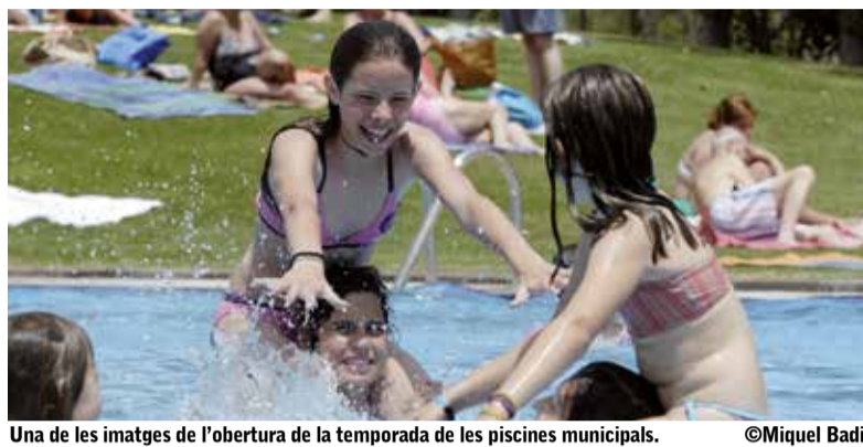
Una de les imatges de l'obertura de la temporada de les piscines municipals.

dilluns a divendres, de 8:15 a 14 hores i dimecres, de 16 a 19 hores. El full d'inscripció dels programes que organitzen les regidories municipals es pot descarregar a la seu electrònica ( https://seu.matadepera.cat ). A banda dels casals, les regidories d'esports i cultura també ofereixen serveis complementaris, com són el d'acollida, de 8 a 9 del matí, i el servei de menjador, de 13 a 15 hores. Pel que fa als campus i casals de les entitats esportives, s'haurà de fer la inscripció a la seu de cada entitat, per correu electrònic, o bé, per telèfon. Trobareu tota la informació detallada de cadascuna de les propostes al fulletó que s'adjunta amb aquesta edició de la Gasetta. El dimecres, 6 de juny, es farà una reunió informativa al Casal de Cultura, on s'explicaran tots els