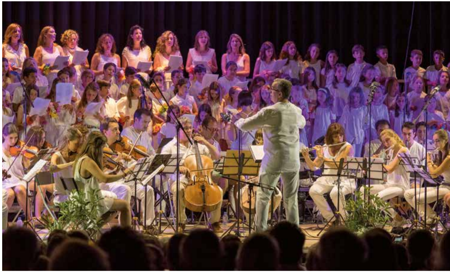
Un dels moments del concert de final de curs de l'Escola de Música Frederic Mompou a l'escenari exterior del Pavelló.

LA SETMANA DE LA MÚSICA I EL PÒDIUM DONARAN LA BENVINGUDA A L'ESTIU