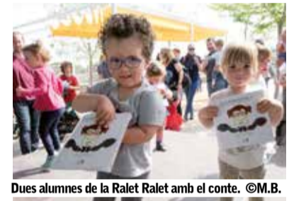
Dues alumnes de la Ralet Ralet amb el conte.

partir com a obsequi a l'entrega de premis dels Jocs Florals d'enguany. Val a dir que a l'EBM Ralet Ralet es dona una especial rellevància als contes, ja que aquests serveixen com a fil conductor de l'aprenentatge, la descoberta i el desenvolupament dels infants dins de l'escola.