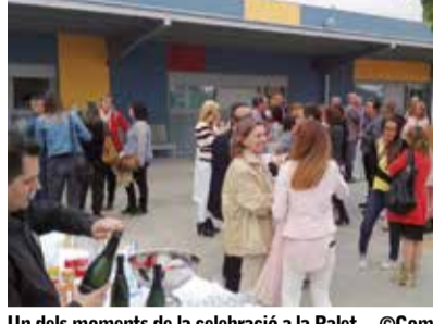
Un dels moments de la celebració a la Ralet.

Amb motiu del desè aniversari de l'EBM Ralet Ralet, el mes passat es va celebrar un acte oficial de recepció a l'escola, amb la presència de representants de tota la comunitat educativa.