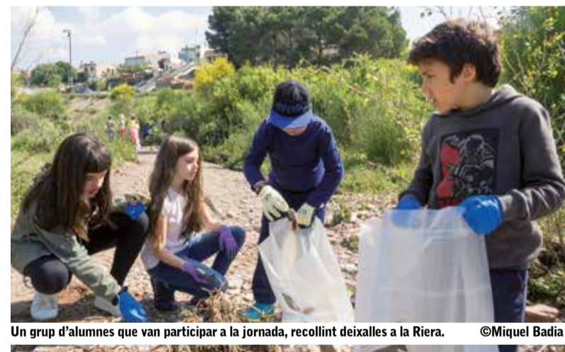
Un grup d'alumnes que van participar a la jornada, recollint deixalles a la Riera.

El divendres 11 de maig totes les escoles i l'Institut van realitzar diverses accions de neteja en zones verdes de Matadepera com el Bosc de les Farigoles, la zona de la Riera de les Arenes davant l'escola o al Mas Sot. I el dissabte 12 de maig al matí va ser el torn de l'Associació de Veïns de les Pedritxes, que va fer una acció conjunta de neteja a tota la urbanització. L'ADF també va col·laborar de la iniciativa amb vehicles i voluntaris.